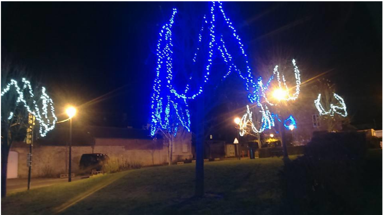
La Place des Tilleuls

L'ensemble de l'équipe municipale vous souhaite d'excellentes fêtes de fin d'année.